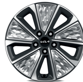
Jantes en alliage de 17" finition diamantée

* Teintes métallisée, nacrées ou bi-ton disponibles en option