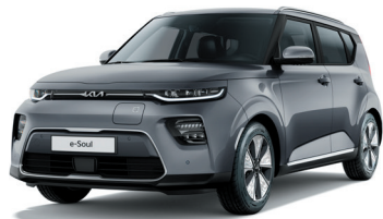
Gris Gravité (KDG)*