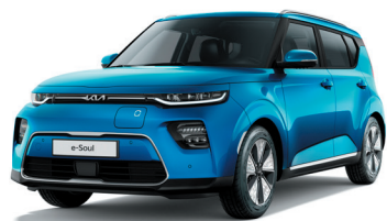
Bleu Cobalt (SRB)