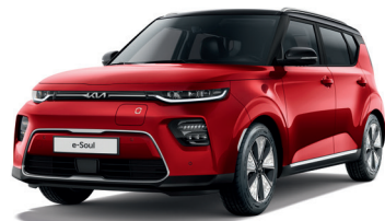
Rouge Inferno / Toit Noir Fusion (FA2)