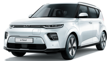
Blanc Nacré (SWP)*