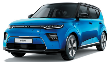
Bleu Neptune / Toit Noir Fusion (FB1)