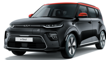
Noir Fusion / Toit Rouge Inferno (FA1)