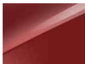
Rouge Rubis (AA9)