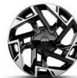
Jantes en alliage 19" Active & Design (Hybride Rechargeable)

Modèle présenté : Nouveau Kia Sportage Hybride GT-line Premium.