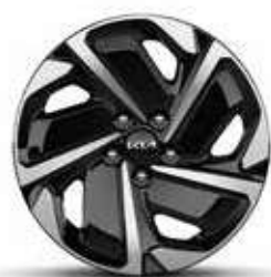
Jantes en alliage 17" Aéro Active (Essence, Diesel & Hybride)