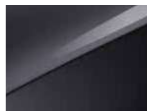
Gris Eclipse (H8G)