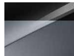
Gris Perle / Toit Noir (HA5)