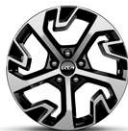
Jantes en alliage 18" Design (Essence, Diesel & Hybride)