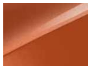
Orange Cuivre (RNG)