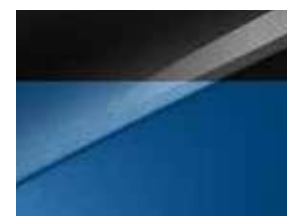
Bleu Fusion / Toit Noir (HA8)