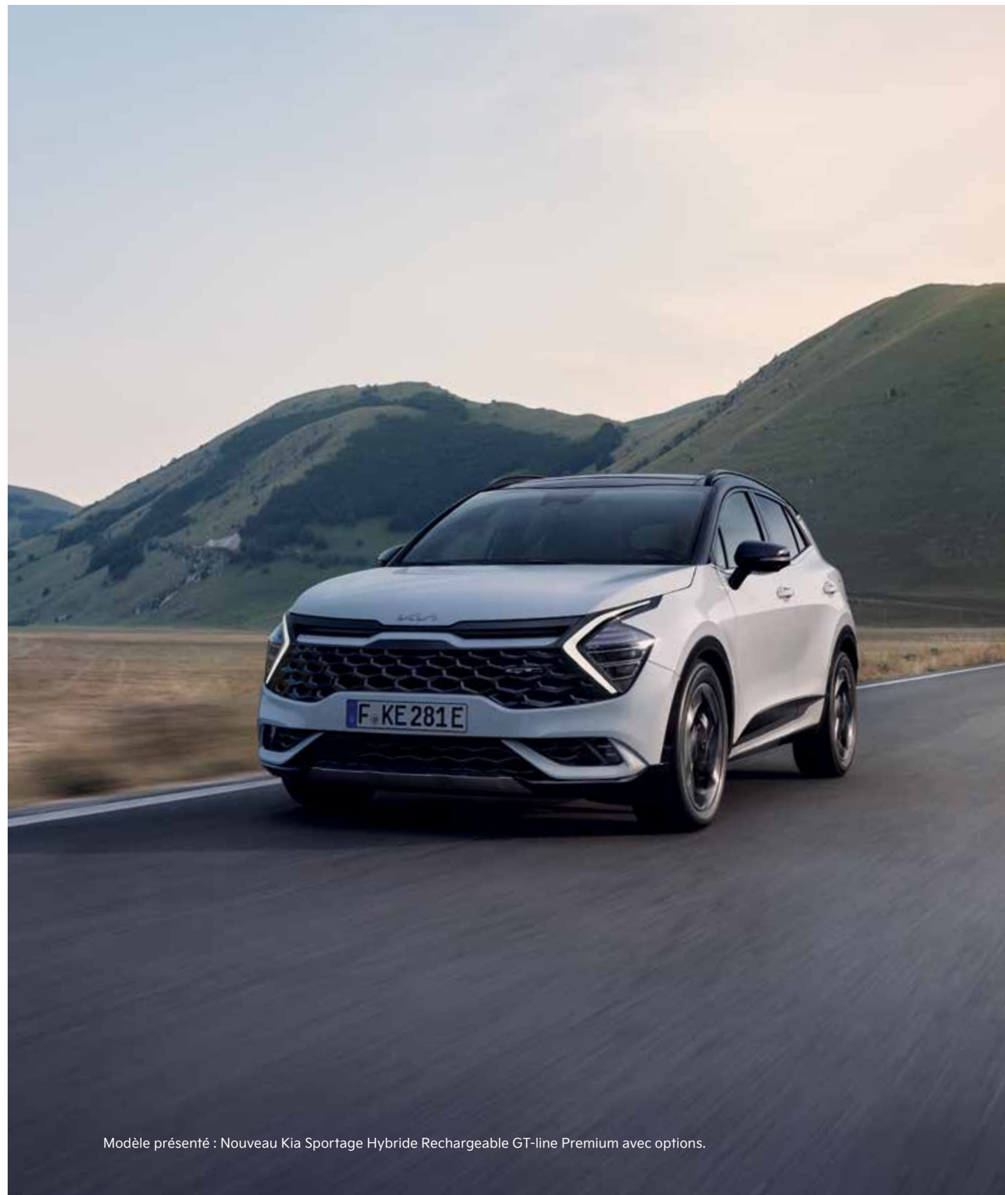
Modèle présenté : Nouveau Kia Sportage Hybride Rechargeable GT-line Premium avec options.

Conçues spécialement pour les versions GT-line Premium essence, Diesel et Hybride Rechargeable, les jantes en alliage avec inserts noir laqué confèrent au véhicule un caractère encore plus sportif.