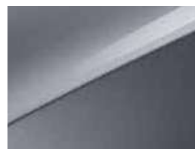
Gris Perle (CSS)