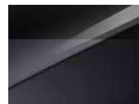
Gris Eclipse / Toit Noir (HA6)