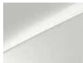
Blanc Sensation (HW2) (1)(4)