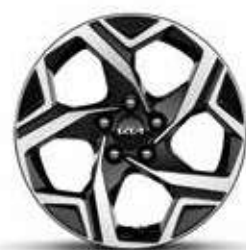
Jantes en alliage 17" Motion

Chaque Sportage a été conçu avec le plus grand soin, jusque dans le moindre détail. Comme en témoignent notamment ses jantes à la fois élégantes, sportives et au dessin réellement impressionnant. Faites votre choix parmi les jantes en alliage 17, 18 ou 19 pouces, disponibles selon les finitions et motorisations.