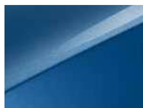
Bleu Fusion (B3L)