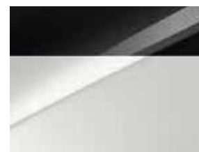
Blanc Sensation / Toit Noir (HA2) (1)

(disponible en option uniquement sur la finition GT-line Premium)