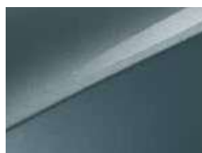
Gris Sirius (USG) (3)