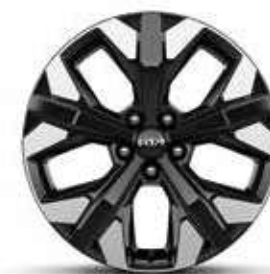
Jantes en alliage 19" GT-line Premium (Essence, Diesel & Hybride Rechargeable)