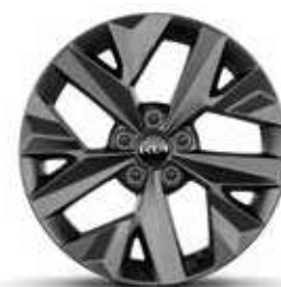
Jantes en alliage 18" GT-line Premium (Hybride)