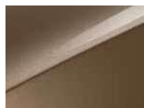
Bronze Ambré (M6Y)