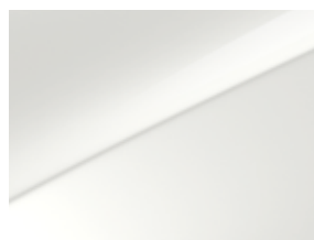
Blanc (WD) (2)