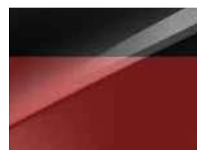
Rouge Rubis / Toit Noir (HA7)