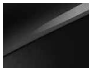
Noir Basalte (1K)