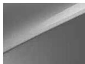
Gris Acier (KCS) (3)