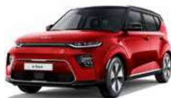
Rouge Inferno / Toit Noir Abyssinie (AH4)*