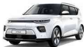
Blanc Nacré (SWP)*