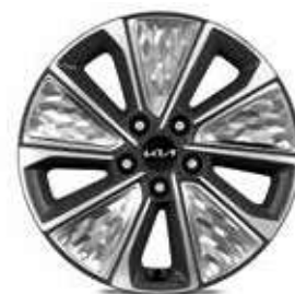
Jantes en alliage de 17" finition diamantée

* Teintes métallisée, nacrées ou bi-ton disponibles en option