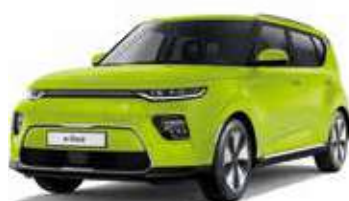
Vert Yuzu (CEJ)