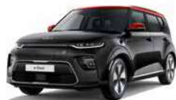
Noir Abyssinie / Toit Rouge Inferno (AH5)*