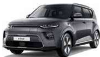
Gris Gravité (KDG)*