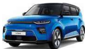
Bleu Neptune / Toit Noir Abyssinie (SE2)*